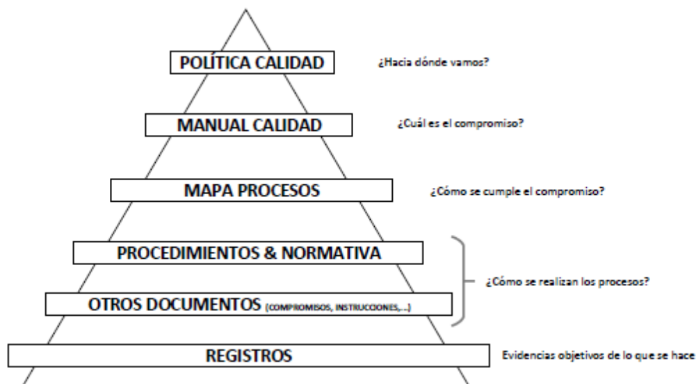
Figura 1. Estructura documental del SGIC de CEINDO

La documentación del SGIC de CEINDO está estructurada como se muestra a continuación: